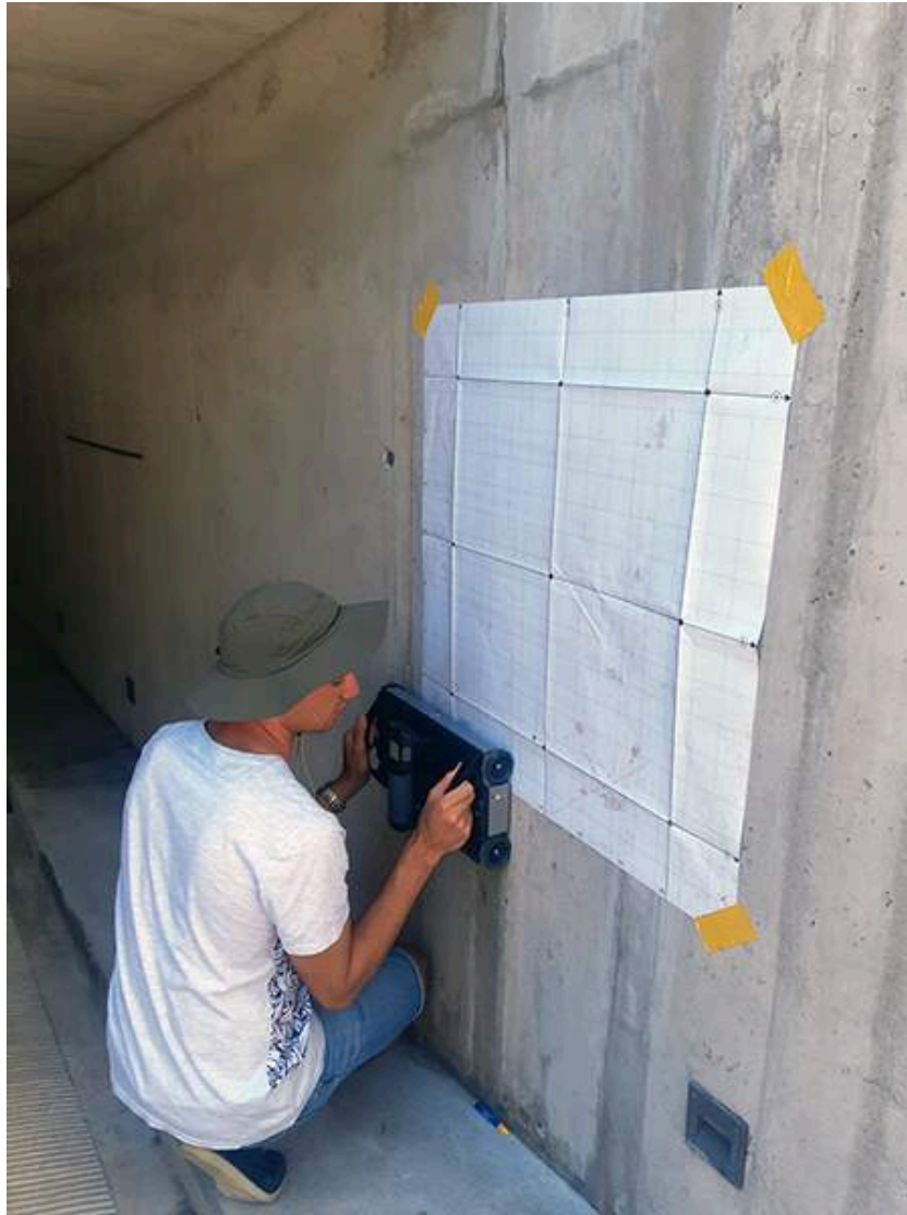
Using the GP8100 to collect an area scan