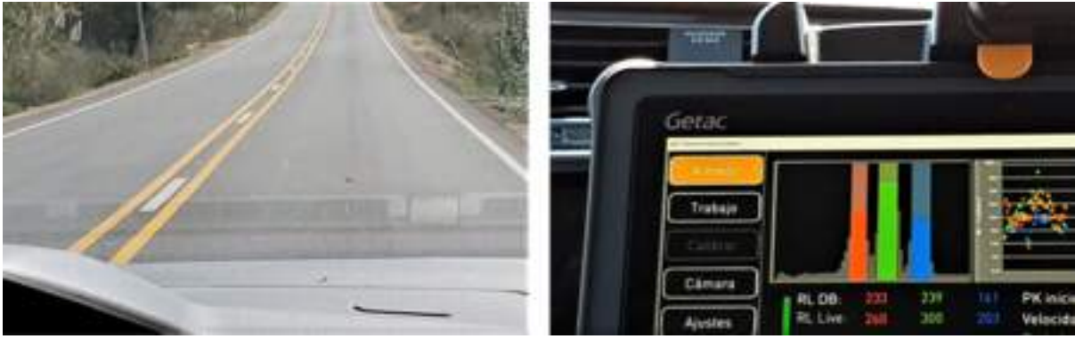
Example of a road with triple road markings (left) and the results as seen live on ZDR6020 software (right).