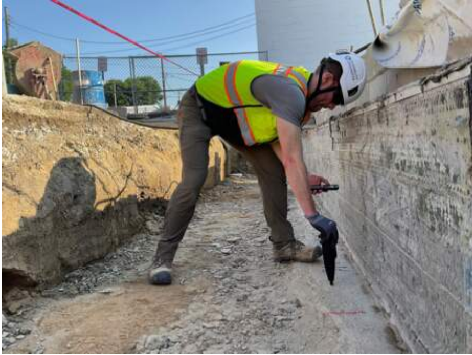
Durability Engineers onsite using the Silver Schmidt Hammer