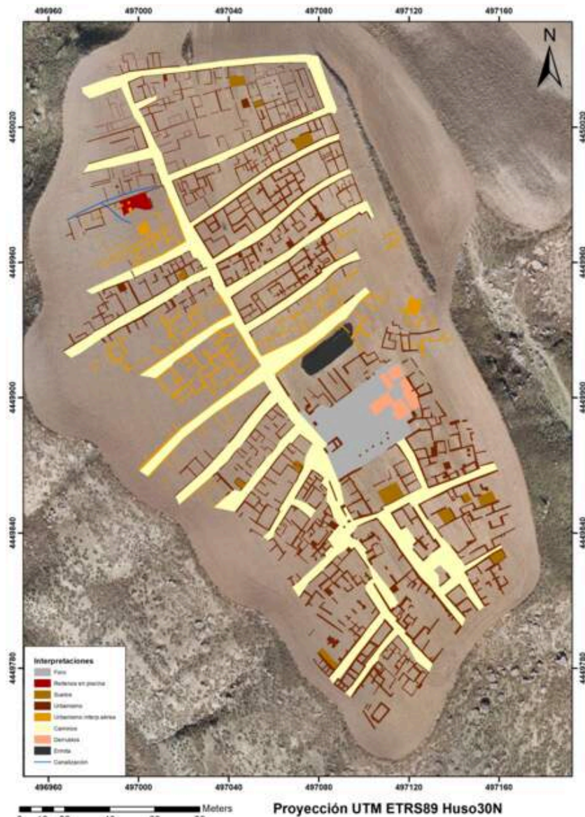
Figure 3. Map of interpretations of results on orthophotography (CAI of Archaeometry and Archaeological Analysis of the U. C. M.).

No resto do local, são detectadas áreas de estruturas de edifícios e ruas com as anomalias correspondentes que irão compor as amplitudes que marcam as cores vermelhas das fatias a diferentes profundidades (figura 2). Inúmeras paredes de vários tipos e espessuras foram detectadas. Reflexos praticamente horizontais com morfologias rectangulares são detectados na vista das fatias do bloco 3D. Correspondem certamente a áreas pavimentadas ou solos do tipo mosaico que, ao apresentarem uma alteração no meio, provocam um pico de reflexão no traço do GPR (figura 1, secções A e B).