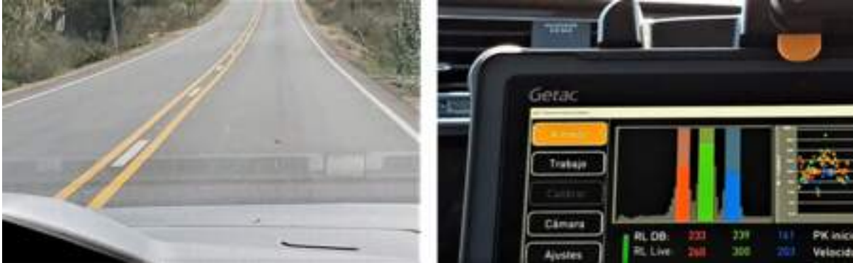
Example of a road with triple road markings (left) and the results as seen live on ZDR6020 software (right).

O Zehntner ZDR6020 é capaz de medir a retrorreflectividade de três linhas em simultâneo. Isto é importante para os aeroportos, uma vez que tais padrões de linhas são comuns.