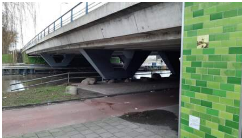
Side view of the bridge and drawings with indications of GPR data collection

Il comune di Utrecht voleva riprogettare una strada contenente un piccolo ponte, dove era necessario spostare alcuni pali della luce. Il cliente di Screening Eagle, Ten Thije, è stato incaricato di verificare se le nuove posizioni dei pali della luce contenessero armature di precompressione.