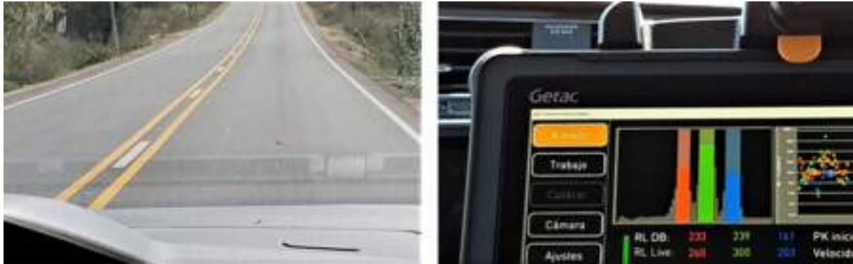
Example of a road with triple road markings (left) and the results as seen live on ZDR6020 software (right).

Lo Zehntner ZDR6020 è in grado di misurare la retroriflettenza di tre linee in modo simulato. Si tratta di un aspetto importante per gli aeroporti, in quanto questi modelli di linee sono molto comuni.