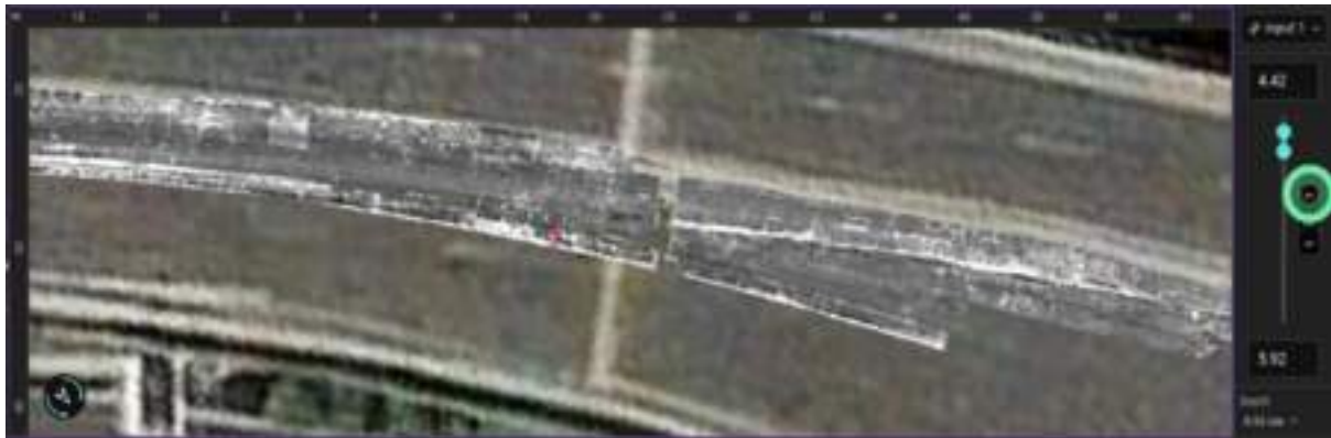
Figure 6. Extended surface layer defects were found at depths of 4 to 6 cm within the asphalt layer.