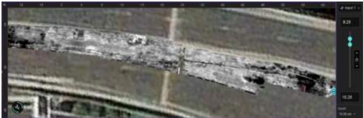
Figure 7. Interface defects between Asphalt-to-Concrete (A/C) layers (Delamination.)