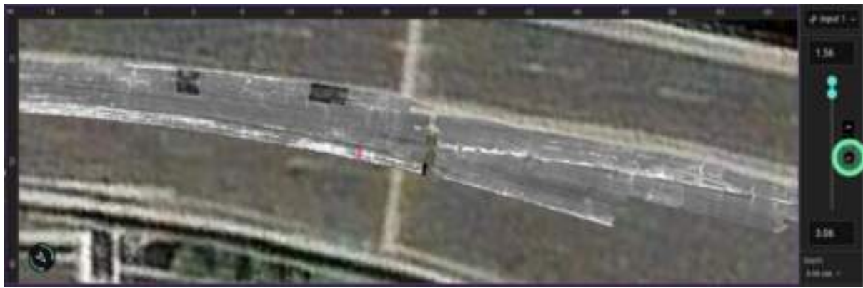
Figure 5. Major surface defects at asphalt layer (cracks)