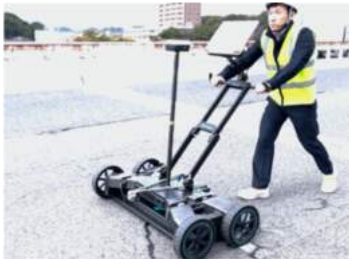
Figure 2 and Figure 3 show the GS9000 system operating on the bridge deck