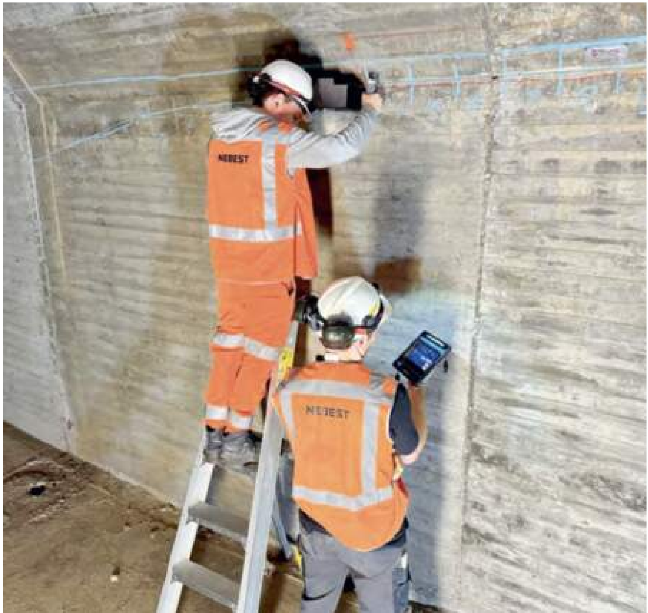
Nebest team using the PD8050 ultrasonic imaging system to detect cavities

Las pruebas ultrasónicas con el PD8050 permiten al equipo cartografiar cavidades relativamente pequeñas. En general, podemos decir que si no se encuentra la cavidad, probablemente sea demasiado pequeña para afectar significativamente al funcionamiento del componente estructural.