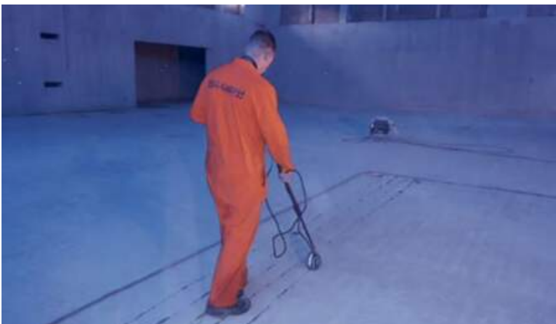
Performing half-cell potential measurements on the concrete floor with the Profometer PM8500 corrosion sensor

Con el medidor de potencial de media celda PM8500 se puede obtener mucha información sobre la actividad de corrosión en una construcción en un periodo de tiempo relativamente corto. Esta técnica se basa en la medición de las diferencias de tensión (diferencias de potencial) que se producen durante la corrosión activa. En los lugares donde se mide un potencial bajo (potencial más negativo), puede haber un punto caliente de corrosión.