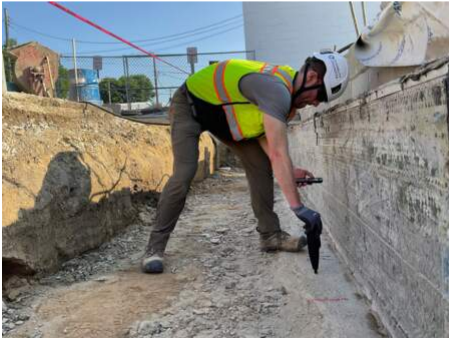
Durability Engineers onsite using the Silver Schmidt Hammer